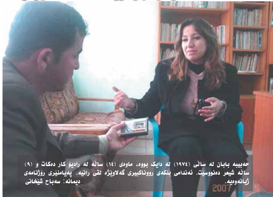
حه بیبه بابان له سالی (۱۹۷۴) له دایک بووه، ماوهی (۱۴) سانه له رادیو کار دهکات و (۹) سانه شیر دهنوویت. له دماهی بنگه ی رووناکیبری گه لایتره لقی رانیه. په میامیری روژنامه ی ژبانه وویه.

دهمینه توه. پینویسته هه ریهک له نیمه له ناستی خوماته وه شتیگ بکین بوئه وهی خهک له وه مشغولیه ناگاداریه که پوهه ژیان بهرده واهه به لام مرزه فکان ناتوان له گهل نهو بهرده واهمه ی ژیان بهرده واهه بن نه ممش و دهکات بینه دزستی خه مکن و له خوزی ژیان دابیرین. بهه ممو مانایهک ده بیت له گهل نهو ژبانه ی نیستا بهرده واهه بین. «هه گهل ژیان خالی کرایوه له شیر نهوکات چی؟» شیر نهو هنده زیندوه هه گهل نه یکوژیت نامریت! شیر جوانیهک ده دانه ژیان. هه گهل شیر نه بیت دنیا شتیگی دیکه ده بیت. مرؤف کانیکی کومه لایه تیه. به لام شیر ده نوایت کومه لایه تی ترت بکات. «نایا شتیگ هه نای نهدی ژبانه بیت؟» باوه رم به نه هدی ژبانه نییه. نه ده ب هه نه ده به به لام کهسه کان ب ژخیان جیای ده که نه وه. جیهای نه ده ب فراوانه. هه ریهک ده نوایت له ناستی خزیوه نیشی تیدا بکات. به داخوه له کومه لکای نیمه له سه هه ممو شتیگ خالیگ داد مینت. له دوی هه ممو شتیگ سنوریک به جی ده بیلت. «زیاتر خوت له شیر یان له کاری رادیوی یان شی تر دبینه بووه؟» خزم له نیوان هه مویان ده دز مسه وه. ناتوانم له هجیان دابیریم. هه مویان گوژارشت له من ده کهن. من ره گه زیم له نیوان هه مویان ده زیم. هه وادارم بتوانم بهرده واهم بم. «رات جیهه له به رامهر له نو گه چانه ی که زوو به ره هه مکنان بلایه ده نه وه؟» هه مست ده کهم (خزایی و په له پل) یک هه ممو شته جوان و ناخوشیهکان ده مته دزین. پینویستان به هه ممو شو شنه هه به که و شیارو به ناگامان ده مینه توه. سه بارت به شتانه هه به که و شیارو به ناگامان