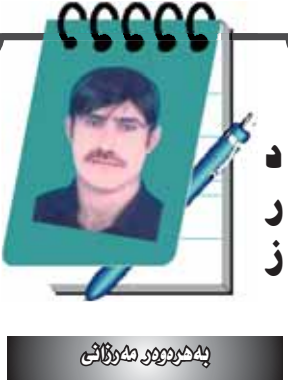
هولیزری پینخته، به‌هه‌شتیک بیژ سواکرین

هوولیز نیه چونکه به‌دیان تابلیزی به‌راچاو ده‌گه‌وی که‌ناری بیانی له‌سر نووسراوه وه له به‌رامهر هر ناویک له‌ی ناوانه به کوردی هه‌یه نه‌گهر بیان نووسیاپه. بیژ نمونه: نازه‌مزل، نیوستی، ریستورات، قاوه‌خانه‌ی سکای، کوردستان نیرلایین، شیرین پالاس، سوپهر مارکیت، ناز ستی، پارکی..... همدت. له‌م رۆزگار و وشه‌ی کوردی نه‌وه‌نه به‌سزیمان بووه. ئه‌مش مانای ئه‌وه ده‌گه‌ینی خوینده‌وی فالتی‌چاپه‌که بیژ ناری کوردی فه‌رامۆش کردنی خبات و ماندووویون به‌ فیژدانی خوینی شه‌هیدان ده‌گه‌ینی. نازانین نووسه‌ور رۆژنامه‌نووسه‌کان بیژهی هه‌لویشتیان نیه‌ووا بی ده‌نگن؟! خۆ ئیستا رۆژم نه‌ماهه له‌چی ده‌ترسن! ئه‌ی ئه‌و هه‌موو ساله‌ خه‌بات‌کرده له‌پای چی؟! «ئه‌گه‌ر بابه‌تی رۆژنامه‌وگزاره‌کان به‌خوینیه‌وه هه‌ست ده‌گه‌ین به‌ دیان وشه‌ی بیانی به‌ زه‌قی پیوه دیاره له‌ناو بابه‌ت‌کاندا، ئه‌ری بیژچی ئیچمه‌ نه‌وه‌نه حه‌زه له‌ وشه‌ی بیگانه ده‌گه‌ین له‌ حیات هه‌بی تا ئیستاش به‌ریه‌یه‌رایه‌تی دابه‌شکردنی نه‌وت بی ده‌گه. خۆ ده‌گرێ له‌ حیات وه‌ داروویزماره