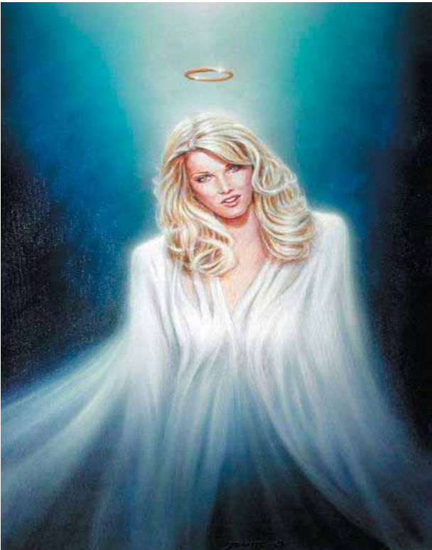
هموو ناره‌تانه‌ ده‌که‌م که به‌هیچ شه‌ویه‌یه‌ک به‌گفت و به‌لێن و قسه‌ی زل و بی‌مانای شه‌م و شه‌وه‌یه‌که‌مانه‌خه‌لێن چۆنگه‌ هه‌رکسی مانانجی له‌ خو‌شه‌ویستی پاک بیت مه‌حاله‌ بیه‌ر له‌کاری خراب بکاته‌وه. چۆنگه‌ خو‌شه‌ویستی مانای ژیان ده‌به‌خشی ته‌ک وێرانکردنی ژبانی مرفۆیک.

ئامۆزاکه‌م ده‌ست درێژی کرده‌ سه‌رم و به‌لێنی پێدام مارم بکا به‌لام درۆی کرد!!